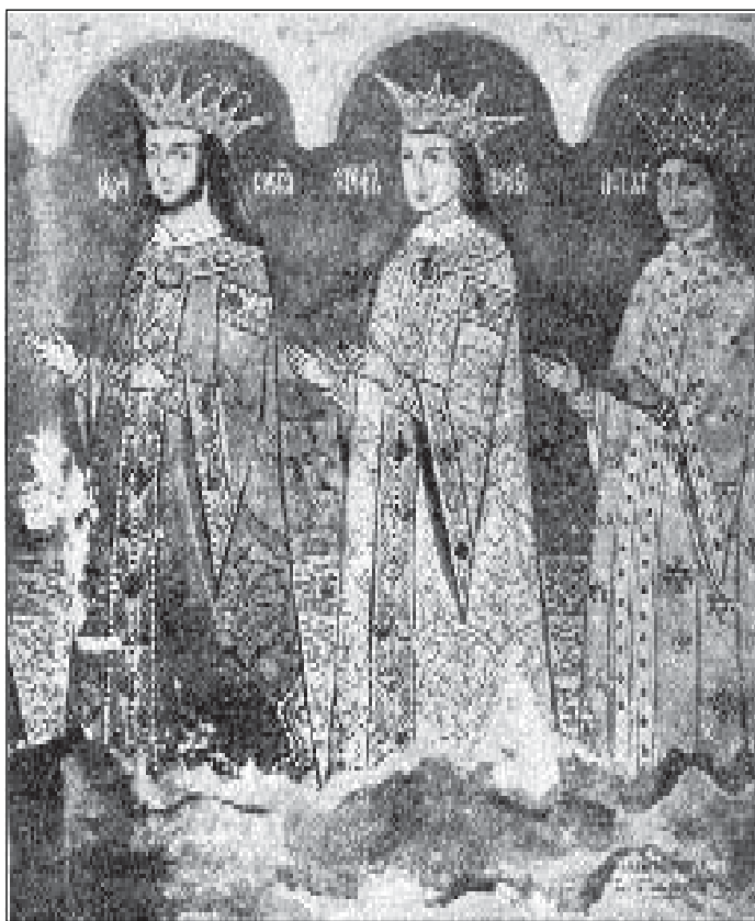
Bogdan voievod (cel orb), 1504–1517, Ștefan voievod (Ștefăniță) 1517–1527 și Petru (Rareș) 1527–1538.

După fresca de la biserica Sf. Nicolaie din Dorohoi (sec. al XVI - lea).