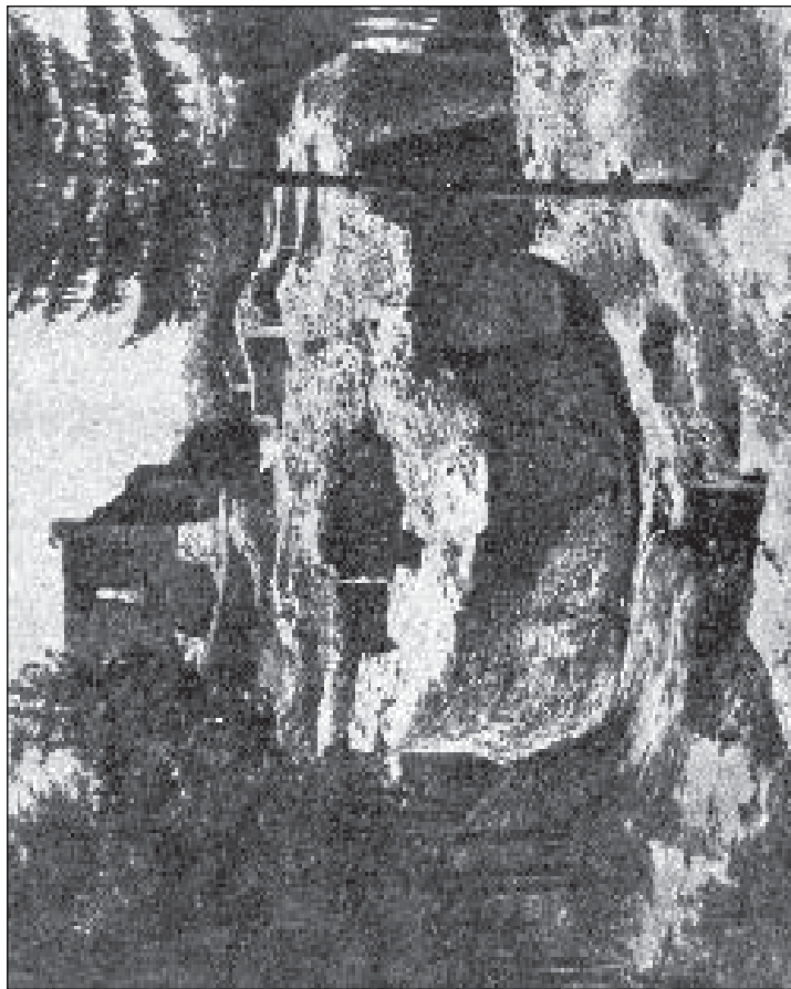
Ruinele cetății Suceava