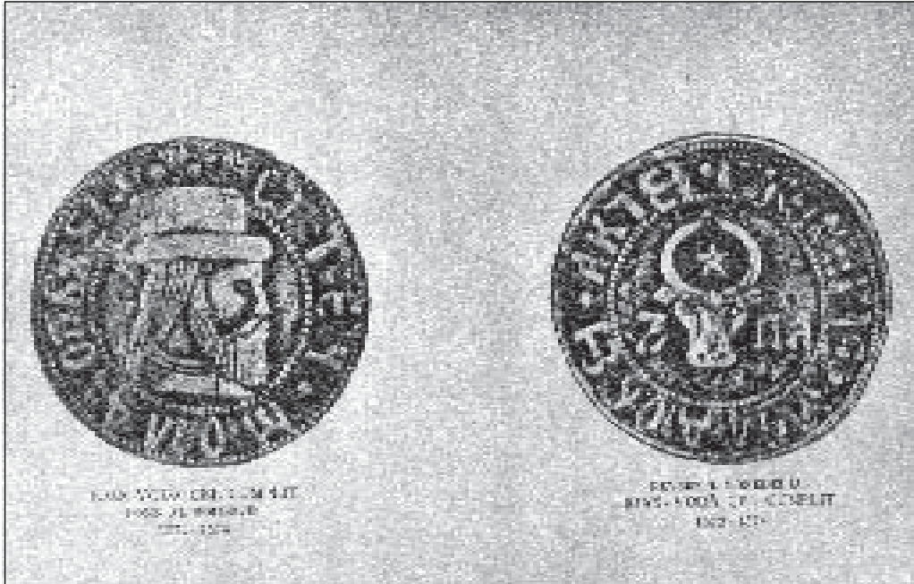
Moneda lui Ioan vodă cel Cumplit N. Iorga, "Portretele domnilor români", vol. 1