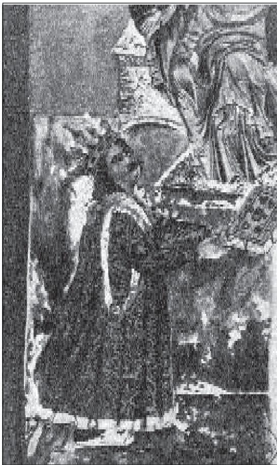
Ștefan cel Mare